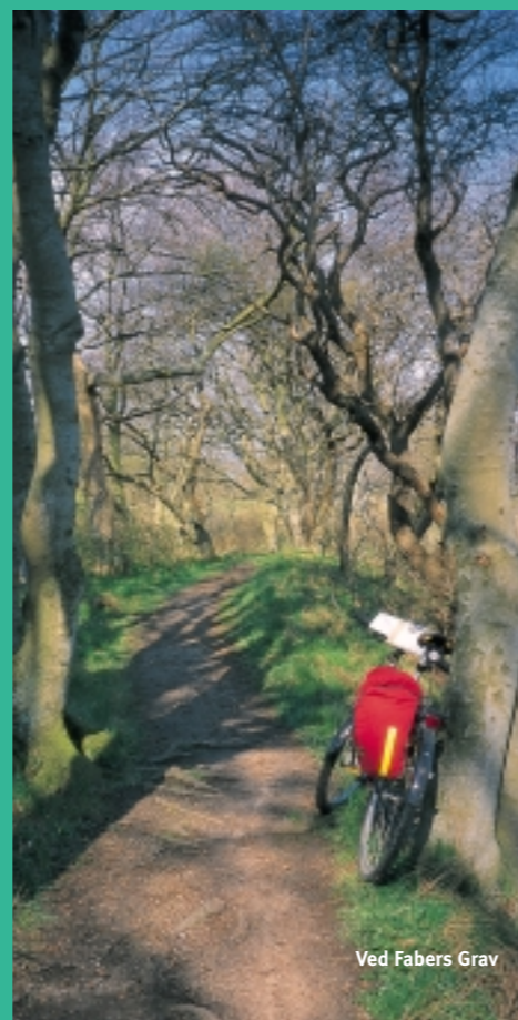
Ved Fabers Grav

Kringledte stier fører ruten ind og ud af Helsingør. Ved Højstrup Trinbræt ligger Teknisk Museum på kystsiden af banen. Her er tit særudstillinger og aktiviteter for børn. Det lille Øresundsakvarie ligger også lige på ruten og er tilsvarende fint for børn med "rørebassin". Imellem disse museer kan man dvæle ved Ophelias Kilde ved stibroen og Hamlets Grav i Marienlyst parkanlæg. Marienlyst Slot er en fint bevaret klassicistisk bygning fra 1700-tallet, som sammen med slottet udgør en enestående helhed. Slottet er åbent som museum. Men den største seværdighed er Kronborg, hvor Hamlet huserede, og hvor Holger Danske passer på vort land. Borgen byggedes til forsvar af indsejlingen til Øresund af Fr. II i 1574. Vandreruten går "lige til døren" gennem en snæver port rundt om fæstningen - en flot afslutning på Nordkyststien.