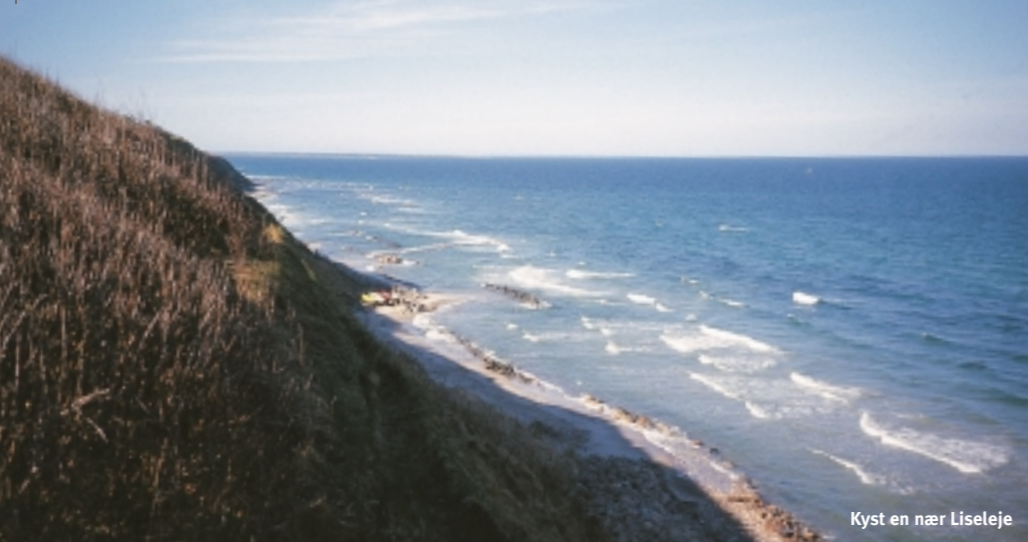
Kyst en nær Liseleje